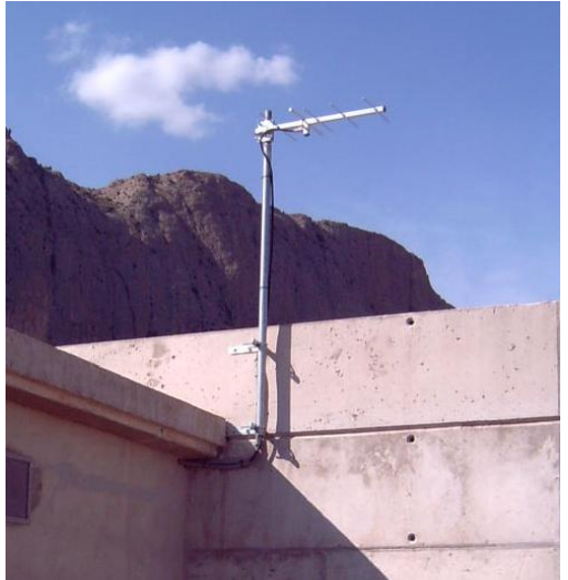
Fig 1, EJEMPLOS DE INSTALACIÓN DE LAS ANTENAS.